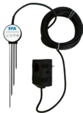
Elektronische Niveausteuerng optional für SANIPUDDLE (siehe S. 108)